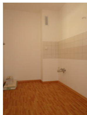
Platz für Ihre Küche!